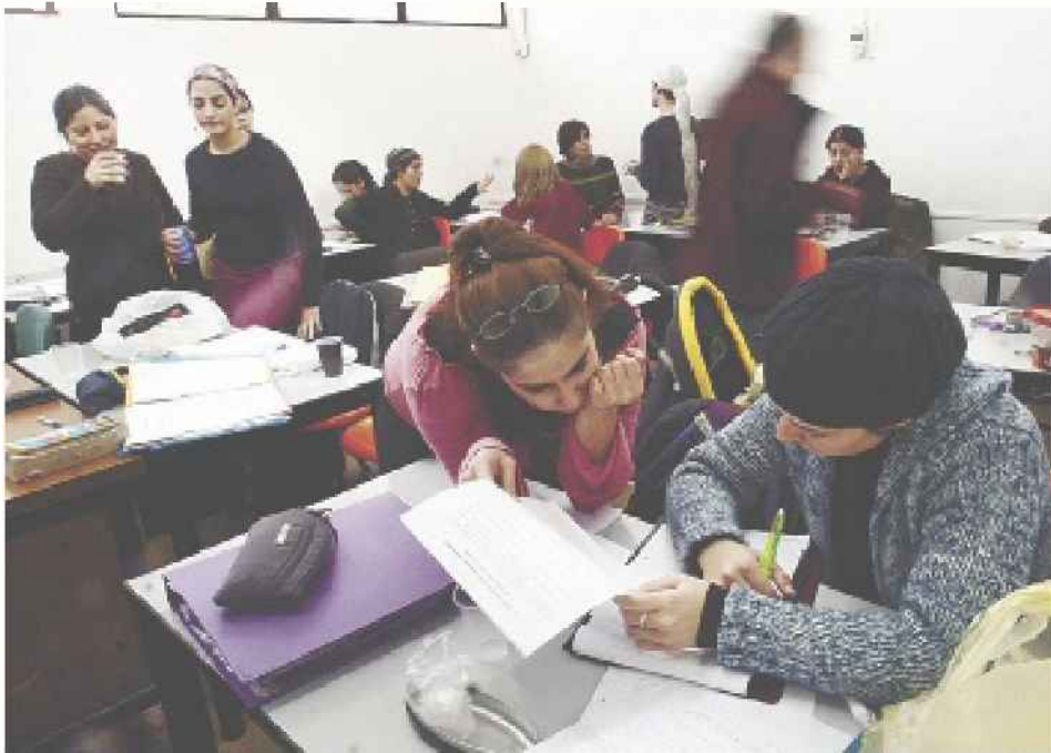
המכללה לבנות בירושלים. 70% מהנשים החרדיות הביעו נכונות ללימודים אקדמיים

« מספר הסטודנטים החרדים הוכפל בתוך שש שנים - מכ-3,000 סטודנטים שפקדו מוסדות להשכלה גבוהה ב-2005-2006 לכ-7,350 סטודנטים חרדים ב-2011-2012 - כך עולה ממחקר חדש של מוסד שמואל נאמן בטכניון, במסגרת פרויקט שילוב לשילוב האוכלוסייה החרדית בתעסוקה וביחידה. אמנם לפי נתוני המל"ג, המעורבנים לומדים כ-6,000 חרדים לתארים מתקדמים, אך המחקר בתוך גם מוסדות שלא נבדקו בידי המל"ג, כמו מכללת בית וגן, מכללת אשקלון ומוסדות חילוניים. המחקר העלה בנוסף כי הפוטנציאל ללימודים גבוהים בקרב חרדים - בעיקר בקרב נשים חרדיות - גבוה ממספר הסטודנטים הקיימים. לפי המחקר, 3,500 נשים חרדיות אמנם לומדות כיום במוסדות להשכלה גבוהה - אך הפוטנציאל מגיע לכ-7,000.